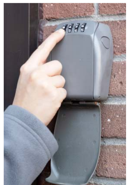
Boven: een veilig saltoslot, daaronder: een kwetsbaar sleutelkluisje.